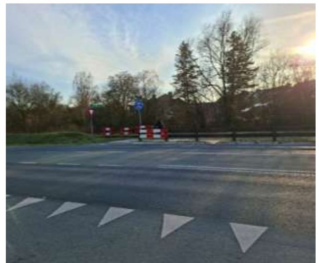
Oversteek Nachtegaalspad over Kanaalweg naar de Kappersweg.

Het antwoord van de Provincie tijdens de bijeenkomst luidde: na de kerst 2025 (begin januari 2026) wordt de Statenbrief verwacht. DiNO geeft aan graag tijdig geïnformeerd te willen worden over de komst van die brief. Dit wordt door de Provincie toegezegd. U zult het al wel aanvoelen... die statenbrief is ten tijde van het inleveren van de kopij (1-4-2026) voor dit artikel in de wijkkrant van DiNO nog niet ontvangen.